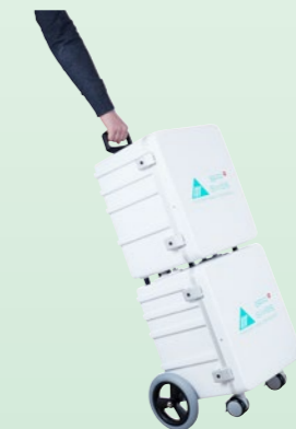
DENTA-TROLLEY and DENTA-CASE combined